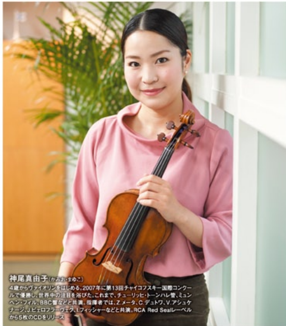
神尾真由子(かみなり まゆこ) 4歳からヴァイオリンをはじめ、2007年に第13回チャイコフスキー国際コンクールで優勝し、世界中の注目を浴びた。これまで、チューリッヒ・トーンハレ管、ミュンヘン・フィル、BBC管などと共演。指揮者では、Z.メータ、C.デュトワ、V.アッシュケナージ、J.ピエロフらとデュオ、I.フィッシャーなどと共演。RCA Red Sealレーベルから5枚のCDをリリース。