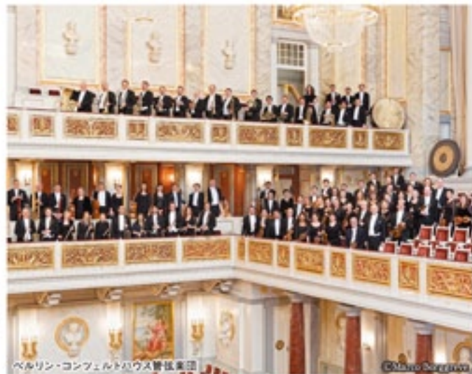
ベルリン・コンツェルトハウス管弦楽団