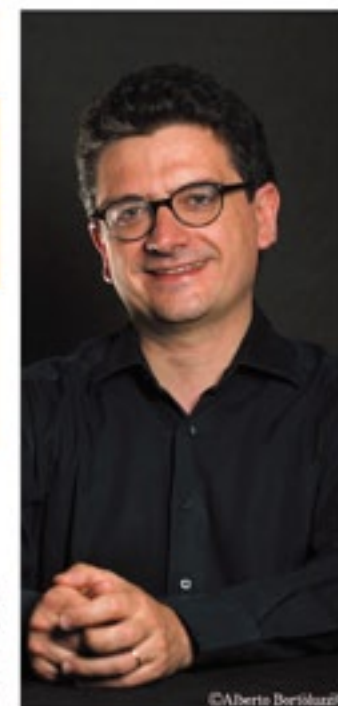
マウリツィオ・クロチ

「ハーモニーホールふくい」開館記念日の頃に行われる恒例のオルガン・コンサート。今回は、ヴァイオリンとの共演シリーズ第3弾。長年N響のコンサートマスターを務めたマエストロ徳永と、イタリアの超有名オルガニストであるクロチを迎えて、ソロあり共演ありの名曲コンサートです。