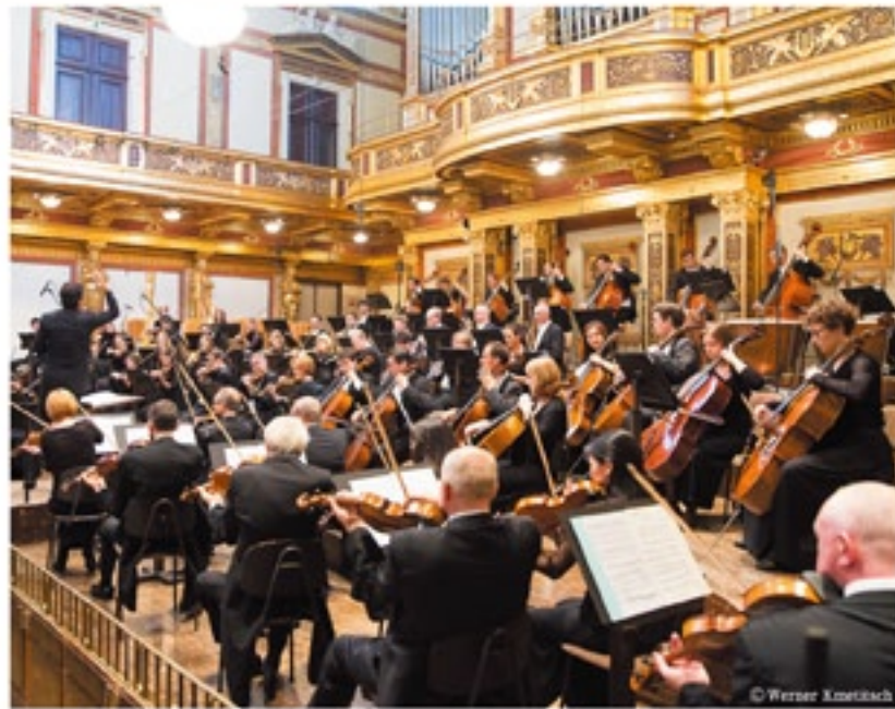
トーンキユンストラ-管弦楽団はオーストリアで108年の歴史を持つ、「ザンクトベルテン祝祭劇場」、「ウィーン楽友協会」、グラフェネック国際音楽祭の開催地「グラフェネック」の3か所を拠点に活動し、同音楽祭のレジデント・オーケストラも務めている。