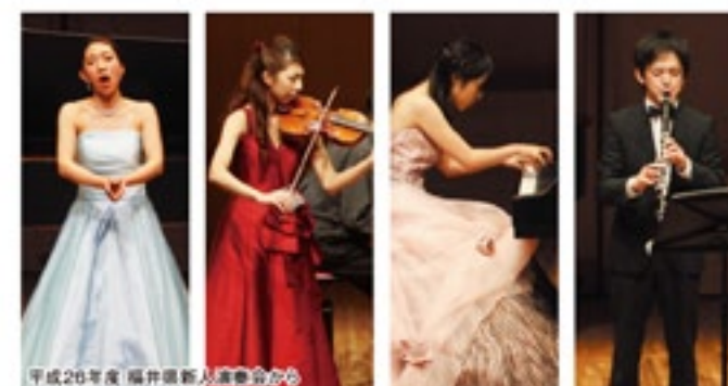
平成28年度 福井県新人演奏会

2017 3.19 日 14:00開演 小ホール 協賛 (公)おげんでんふれあい福井財団