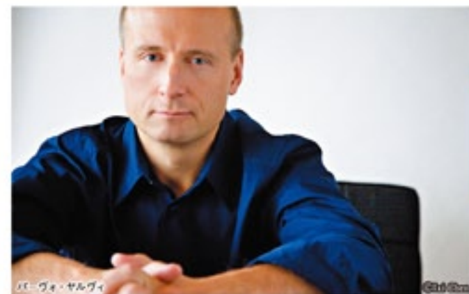
パーヴォ・ヤルヴィ

都響を率いての2013年のコンサートも大好評でしたが、あの時のプログラムはチャイコフスキー。「次は絶対マーラーを!」と短冊に願いを、いやアンケートに希望を書いた方も多いではありませんか。お待たせしました。インバルのマーラー「巨人」、それも自らが育てたオーケストラでの演奏です。カップリングはピアノ・コンチェルト「皇帝」。なんと賞賛でスケールの大きなプログラムです。