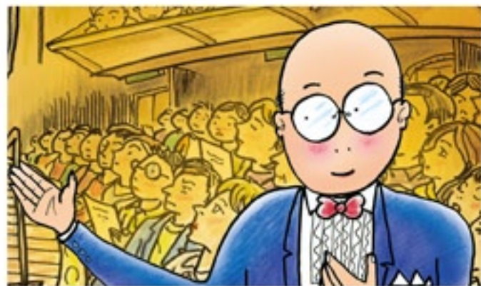
イラスト/青島広志

全席自由 ¥500 小〜高校生・車いす席 ¥100 出演/お話、ピアノ:青島広志 オルガン:黒瀬 恵、テノール:小野 勉、ソプラノ:東 園 曲目/青島広志:「風に色をぬりたいな」or「夜空のクリスマス」 「少女の季節」or「クリスマスの夜」 スヴェーリンク:「おかしなシモン」による主題と変奏 or <共催>(公財)石川県音楽文化振興事業団