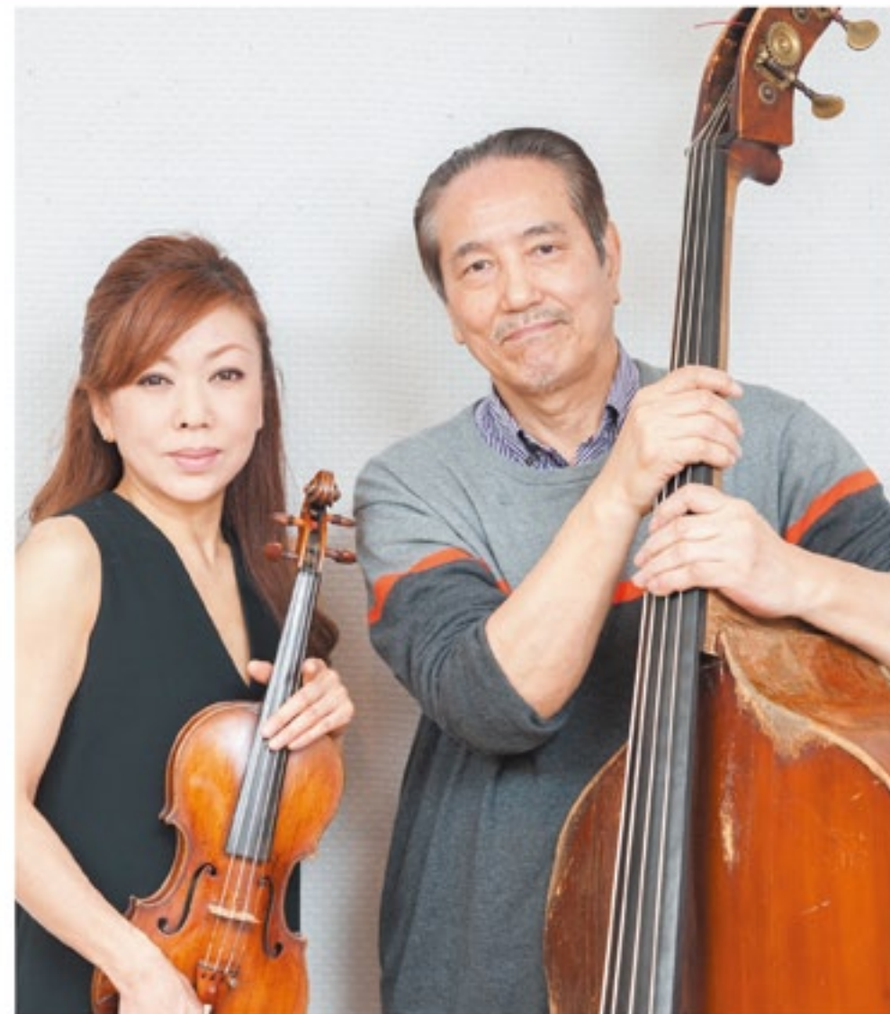
ベーシスト ヴァイオリニスト

に移っていく2人。観客といい時間を共有したいという想いは、相手が子どもでも大人でも変わらない。