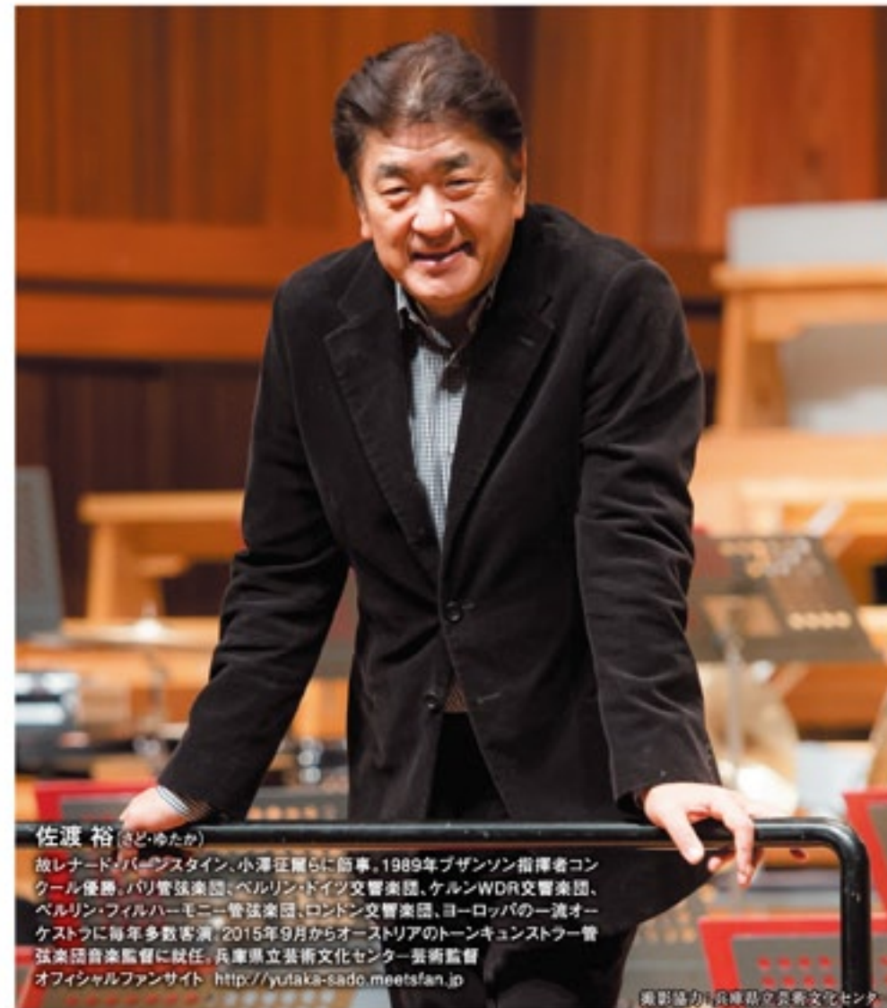
佐渡 裕 (さど ゆたか) 故レナード・バウスタイン、小澤征爾らに師事。1989年プザンソン指揮者コンクール優勝。パリ管弦楽団、ベルリン・ドイツ交響楽団、ケルンWDR交響楽団、ベルリン・フィルハーモニー管弦楽団、ロンドン交響楽団、ヨーロッパの一流オーケストラに毎年多数客演。2015年9月からオーストリアのトーンキユンストラ-管弦楽団音楽監督に就任。兵庫県立芸術文化センター芸術監督 オフィシャルファンサイト http://yutaka-sado.meetsfan.jp 撮影協力：兵庫県立芸術文化センター

で、若い頃から憧れていたオーケストラの指揮台に立ちたいというのがありますから。ただ、「1万人の第九」を17年やってきたこと、兵庫県立芸術文化センターの芸術監督を10年やってきたこと、その中で培ってきたものはトーンキユンストラ-に生かされると思うんです。よね。だからやっていくことはあ