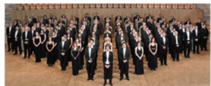
スペイン国立管弦楽団は、1942年に設立されたスペインを代表するオーケストラ。バロックから現代まで幅広いレパートリーを持つ。

ラロの曲なので、フランス的でもあるこの曲をスペインのオーケストラでやるのは、とても楽しいでしょうね。実は、小学校5年生の時、コンクールの課題曲で第1楽章を弾いていて、人前で弾くのはそれ以来なんですよ」 「ハーモニーホールふくい」は、2014年のスイス・ロマンダ管弦楽団との共演以来2年ぶり。 「ロマンダ管との時は、管楽器でこんな色合いの音が出るんだ！と驚きました。素晴らしいホールですから、今度の共演も楽しみです」