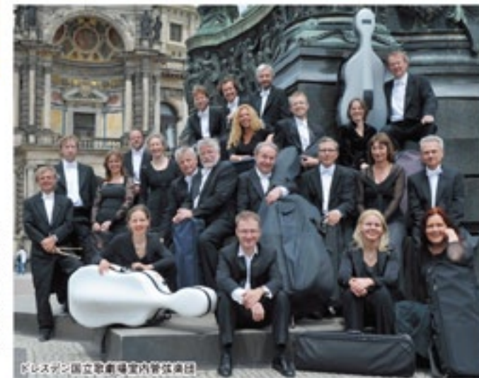
ドレスデン国立歌劇場室内管弦楽団