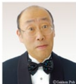
青島広志(あおしまひろし) 東京藝術大学、同大学院を首席で修了。これまで作曲した作品は200曲にも及び、指揮者・ピアニスト・プロデュース等活躍中 テレビ「顔のない音楽会」他多数出演。東京藝術大学、都留文科大学講師