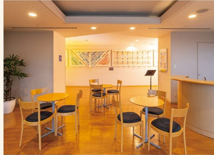
カフェのような雰囲気、ちょっとした休憩や打合せにご利用いただける空間。廊下には越前和紙による美術作品が飾られています。また廊下の反対側は一面がガラス張りになっていて、自然光を感じながらお過ごしいただけます。

きくちりょうた ●日本大学芸術学部音楽学科および同大学院修了。現在は、テレビや映画、アニメ、ゲーム音楽をはじめ、東京オリンピックCM等の楽曲提供も手掛ける。YouTubeチャンネル登録者数51万人の人気ピアノYouTuberとしても活躍中。