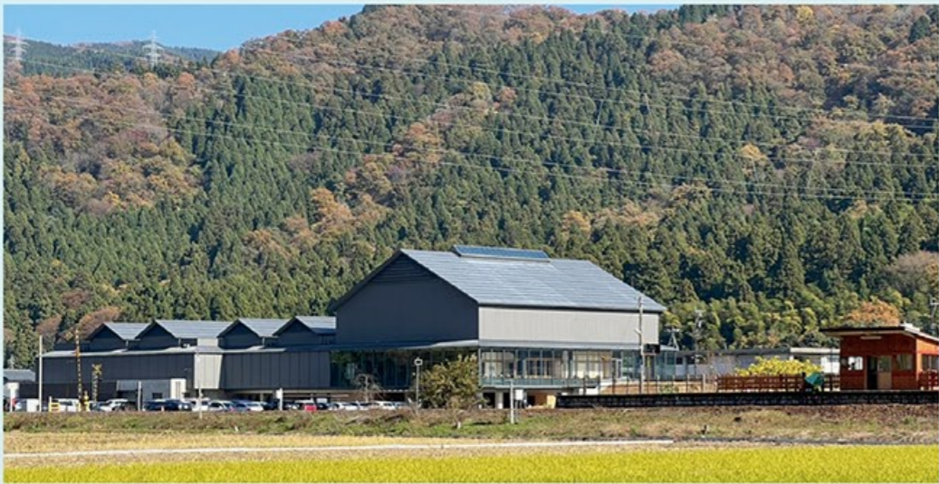
令和4年10月1日開館の一乗谷朝倉氏遺跡博物館

一乗谷は生まれ故郷である。発掘調査が始まったのは私が生まれる10年前で、記憶の中にある遺跡は、まだ今のように整備が進んでおらず、原野のようであった。小学校に入ったころ武家屋敷の復原が完成し、様々な施設が徐々に整っていった。それでも地元の小中学生にとっては、ここが何か特別な場所だという感覚はなかったように思う。 小学校高学年で、学校の目の前にある上城戸の発掘調査に参加する機会があった。指導を受け、土を慎重に掻き分けながら、遺物を探した。歴史好きな男子が変わった形の石を見つけ、やじりではないかと騒ぎ、みんなでひとしきり盛り上がった記憶がある。結局ただの石だったのだけだ。 小学校の行事で一乗城山オリエンテーリングがあったことも鮮明に覚えていて。英林塚ルートから登り、馬出ルートを下る。途中のクイズに答えつつ、設定時間に最も近いタイムで唐門前にゴールしたチームが優