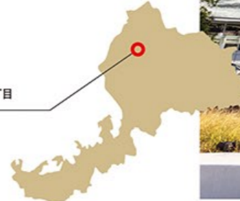
JR福井駅 住所／福井市中央1丁目