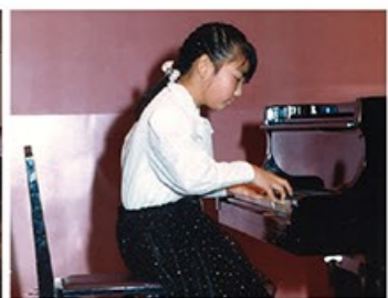
小学校4年生時のピアノ発表会(フェニックス・プラザ小ホール)。メンデルスゾーン作曲「ロンド・カプリチオソ」を演奏中。

■今後の活動 来年度、関西方面(大阪、京都、兵庫)を中心に、学校公演(文化庁、尼崎市)や、リサイタルの伴奏(ドイツリット、トランペット、フルート)、トリオ演奏(フルート、クラリネット、ピアノ)などに出演予定。