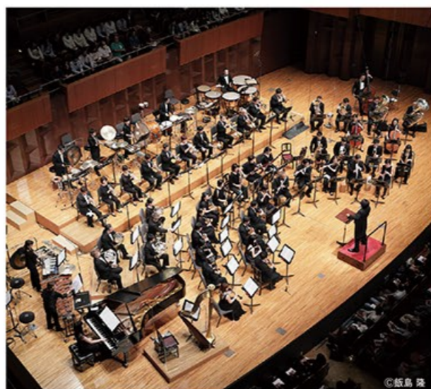
吹奏楽：Osaka Shion Wind Orchestra