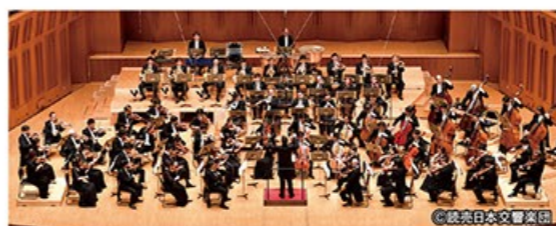
管弦楽：読売日本交響楽団

新年を寿ぐ、華麗な オーケストラ・サウンド 2023年のニューイヤーコンサートで取り上げる2曲は、いずれもハーモニホールふくいの豊かな音響空間に映える作品です。リヒャルト・シュトラウスの「アルプス交響曲」は大編成のオーケストラの響きが特徴。アルプスの山を登りながら、夜明けから日没までの雄大な景色がまるで映像を観るように克明に描かれていきます。金管楽器の