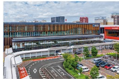
福井駅東口から見る北陸新幹線福井駅。「太古から未来へ〜悠久の歴史と自然がみえる駅〜」がデザインコンセプト。明るく開放的なガラスに唐門をモチーフとした木を組み合わせ、内装には県産木材や越前和紙などが使われている。