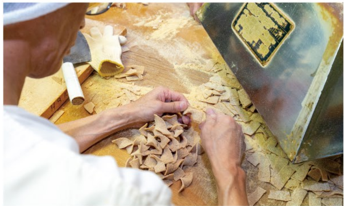
平らな短冊を取って、ひねって、手前に置くまで、約1〜2秒。欠けているものや割れてしまったものはここで除ける。どうしても捨ててはならず、次の回の生地混ぜ込んで再利用。無駄がない