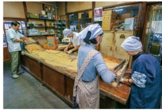
抜群のチームワークで、流れるように生地がどんどん小さく断断されていく