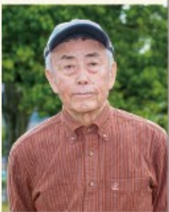
出身地/1933年 福井市生まれ 著 書/福井の山150 夜明けの霧の山 日本海の見える山 など