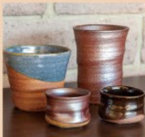
「山の暮れに」では、伊作は裏山から採れる赤土で焼き物をつくる。岡田だけでなく、佐分利川沿いの土地では昔から鉄分が多い赤土粘土が出土した。鹿野にある「きのこの森」からも古い窯跡が見つかっており、最近「今谷(いまだん、当地の昔の地名)族」の名前で、地元の土を使った焼き物を復活させた。「きのこの森」内の陶芸館で、今谷窯に焼くことが出来る