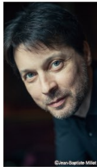
指揮：ロベルト・フォレス・ベセス

注目のソリストと指揮者で二大作曲家を堪能 人気のNHK交響楽団が、2年ぶりの来福です。プログラムは、チャイコフスキー&ドヴォルザークと、これまた人気の作曲家同士の組み合わせ。おなじみのチャイコフスキー「ピアノ協奏曲第1番」と、ドヴォルザーク作品の中