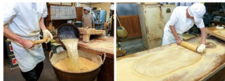
水飴と砂糖を煮詰めたものを、あら粉の容器に投入して練(つ)き混ぜる。どれぐらい混ぜ込むかは長年の勘 ここから時間との戦い。年季の入った台の上いっばいに生地を伸ばしていく

水飴・砂糖・水を煮詰めたものが、あら粉(きな粉の粗いもの)と煎った白ゴマの入った容器に投入されると、そこからあつと言う間です。容器の中でまとめられた生地を、まず麺棒で、次に機械で延ばし、その端から手作業と機械で短冊状に切断していきます。そ