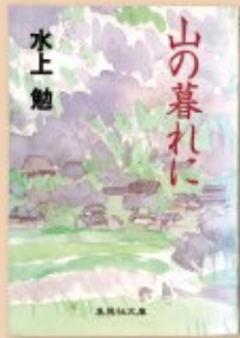
水上勉『山の暮れに』 1993年 集英社文庫(元本は1990年 毎日新聞社刊)

た田舎の柿。そんな柿の木がないかと、「山の暮れに」の舞台のモデルであり、水上の生まれた地でもある岡田の集落を散策していると、山際にある神社のそばに、すっかり葉が落ち実だけが残った柿の木が一本立っていました。撮影している、近所の方が「すぐそこに水上先生のお家があったのよ」と教えてくれました。神社の上の方に上っていくと、もうそこは草地になり、すぐ後ろの山に飲みこまれようとしていました。