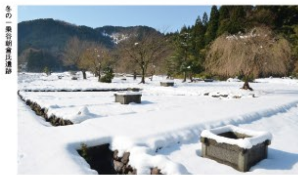
冬の一乗谷朝倉氏遺跡