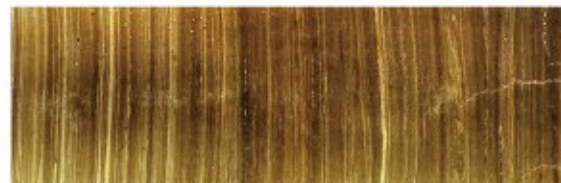
夏場は黒っぽく冬場が白っぽい。間近で見ると一つ一つの縞がはっきりわかる。1年分で平均約0.7mm