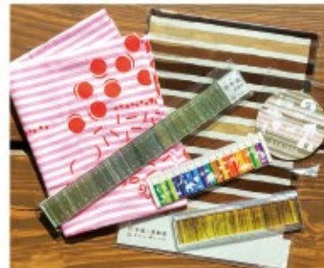
ミュージアムグッズも充実。年縞物差し、クリアファイル、コースター、手ぬぐいなど