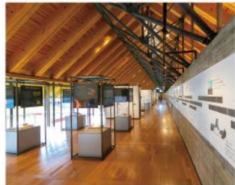
本物の年縞パネルの裏は、年縞とともに人類と環境の歴史をたどる年表。また、年縞の仕組みや世界の年縞などの展示もある