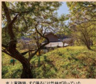
水上家跡地。すぐ後ろには竹林が迫っていた