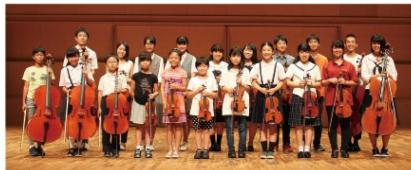
平成30年度 福井ジュニア弦楽アンサンブル・セミナー受講生