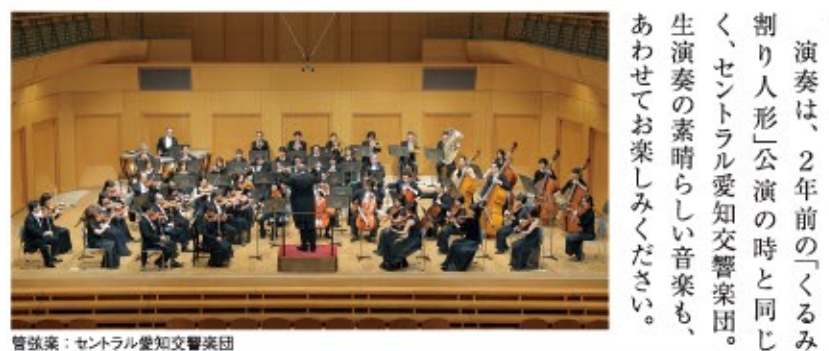
管弦楽：セントラル愛知交響楽団

「ワガノワ・バレエ・アカデミー」は、ロシアが誇る国立バレエ総合教育機関。全世界から集まった精鋭たちが、切磋琢磨しながら削り上げる舞台は、ロシアのバレエの底力を感じさせます。 「人形の精」は、人形売りが舞台。夜の売り場に閉じ込められた男の子が、人形たちが繰り広げるお祭りの夢を見ます。様々なキャラクターの人形たちが登場しますが、次の朝には何事もなかったように……。組曲は、夜の宴の様子を描いたものです。 「パキータ」は、フランス人