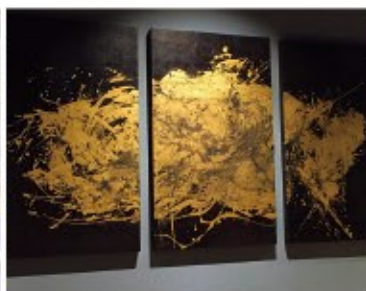
「時ノ鐘」(福井市浜町)の内装に描いたもの。漆をひいた和紙に特殊塗料と墨