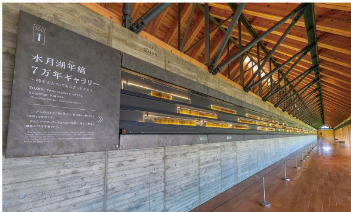
2014年の第四次調査で採取した年縞を、凍結乾燥して樹脂で固め、薄くスライスしたものを展示。一度に約1mlしかボーリング出来ないのので、場所を変えながら採取して、途切れがないようにしている。これだけ長く途切れのないものは数が無く、2012年に世界標準に採用された