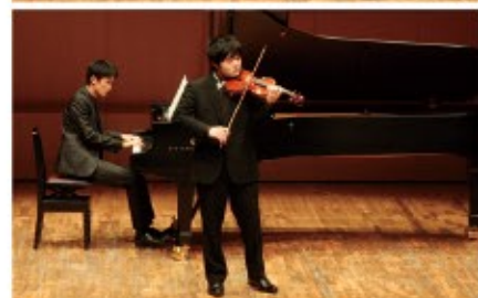
平成29年度 福井県新人演奏会から

未来の「巨匠」がここに? 新鋭誕生に立ち会う楽しさ ここから果立ち、国内外で活躍する演奏家は数知れず。毎年恒例の「福井県新人演奏会」です。今回は、この演奏会を何倍にも楽しむ方法をお教えしま