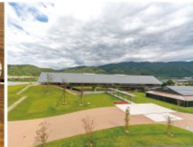
博物館の向こうには、鯛(はす)川とそれが注ぐ三方湖が見える