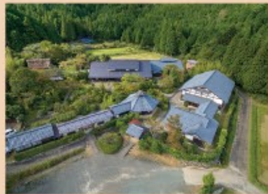
1985年、水上勉が岡田に開設した施設「若州一流文庫」。子どもたちに本との出会いをという水上の願いを込め、自らの蔵書の他、美術や文学関係の資料などを展示。若州人形座の拠点でもある。現在はNPO法人一滴の里が運営。岡田のメインの集落とは小山ひとつ隔てた谷にある