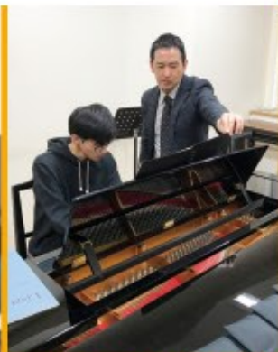
東京藝術大学で後進の指導にあたる