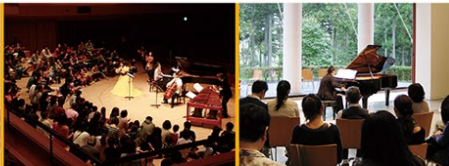
「ステージできくコンサート」第1回(2013年10月20日)の様子。お客様にも手拍子で参加いただくなど、様々なアイデアが盛り込まれました。