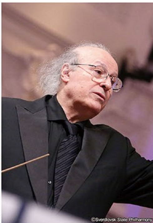
指揮：エリアフ・インバル