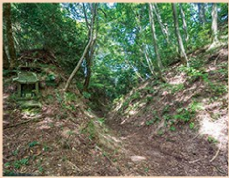
大坂峠。馬借街道で一番高い標高280m。右が街道。左にお地蔵様の祠。右手前には街道から分かれて展望台へ登る道がある

ゆるやかな丹生山地を通過して越前府中と敦賀を結んだ物資輸送路馬借街道は、越前市の街中から丹生山地を通過して越前海岸の今泉に出て河野に至る約15kmの道です。西街道とも呼ばれ、北陸道の脇道でした。越前から畿内へ行くには、北陸道の険しい木ノ芽峠や栃ノ木峠を通るより、馬借街道で海へ出て船で敦賀へ入る方が山越えの苦勞が少なく、戦国時代から盛んに使われるようになりました。河野浦が北前船で栄えた江戸時代には、北陸と畿内・太平洋側を結ぶ重要な物資輸送