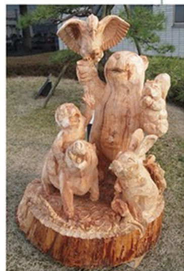
「森はきっと教えてくれる」(2012年制作)。樹齢約100年・直径約1mの丸太を使用。クマの周囲をウサギ、リス、キツツキ、サル、イノシシたちが囲む。現在は福井県総合グリーンセンターに設置されている。