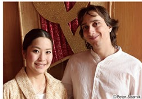
ヴァイオリン：神尾真由子 ピアノ：ミロスラフ・クルティシエフ

曲 ブラームス: ヴァイオリン・ソナタ 第1番 ト長調 Op.78「雨の歌」 ヴァイオリン・ソナタ 第2番 イ長調 Op.100 ヴァイオリン・ソナタ 第3番 二短調 Op.108