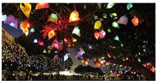
みなさんの笑顔でつくる「ひかりの実」が夢のような夜景に 参考作品 HOPE 三重・横浜ひかりの実交換プロジェクト(山下公園・横浜) WORKSHOP福井市内2011年 ※福井での公開制作は11/26(土)