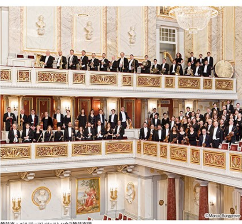
管弦楽：ベルリン・コンツェルトハウス管弦楽団

取ったものです(ただしマーラー自身は、後期の演奏会ではこの標題を使っていません)。童謡フレール・ジャック(日本では「グリーチキパー」で何つくろう)ですね)の旋律をモチーフに使うなど、当時の交響曲としては斬新で実験的な要素がみられることから、初演時には酷評されたそうです。そんなナイヴにして破天荒な若いマーラー作品を今年80歳のイ