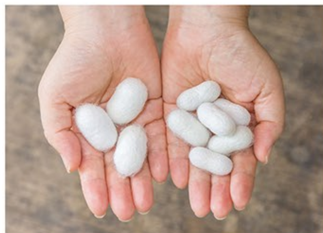
玉小石の繭。左が玉繭、右が半繭。玉小石は約3割が玉繭になる(普通の蚕は2~3%)。玉繭からは、空気を多く含む強くてしなやかな糸が取れる。今年の出荷は6月と10月の2回