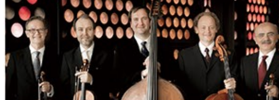
ベルリン・フィルハーモニー・ヴィルトゥオーゾ

繊細にしてエネルギー溢れる達人たちの響宴。「ハローモニーホールふくい」では東儀秀樹・cobaとのユニットTFC55でおなじみ、お客様アンケートでも人気の高い古澤巖が、至高の室内楽アンサンブルと共演です。ベルリン・フィルの選抜メンバーによる「ベルリン・フィルハーモニー・ヴィルトゥオーゾ」と古澤は、「ヴィルトゥオーゾ」からの強いオファーで何枚もアルバムをレコーディングし