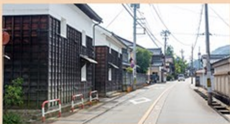
広瀬町の町並み。蔵や長い板塀があり、街道の雰囲気を漂わせている。この通りを西へ進むと道分があり、「府中馬借街道」の看板に従って川沿いの道を進むと駐車場がある