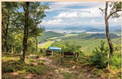
大坂山山頂。山頂広場は地元の方により整備され、ベンチのある展望台になっている。越前市街地はもちろん、日野山、村国山など越前市の山々から奥越の山々、見晴らしがよい日には白山まで見える

路となり、米、様々な食料品、日用品などが運ばれました。上り荷には打刃物、下り荷には京の織物などもありました。(※) 現在の馬借街道は整備され歩きやすくなっています。越前市広瀬町の西のほうに駐車場があり、そこから山道に入ります。登り口から約950mで大坂峠に到着。峠の少し下にも越前市街が見える場所がありますが、峠から10分ほど登った大坂山山頂の展望台では、さらに眺めが広がります。手前には今通ってきた広瀬町の集落も見えます。