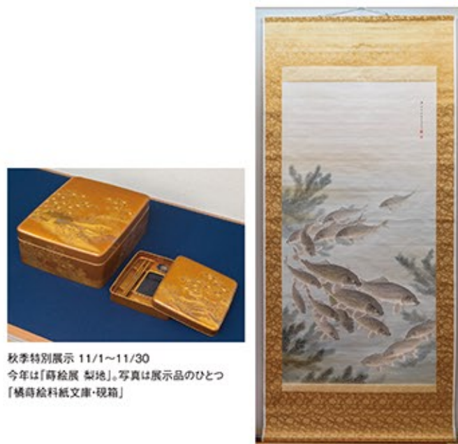
内海吉堂「鯉群遊泳の図幅」(1900年)。吉堂は、山田介堂、長田雲堂と並んで「福井県三堂」の一人として知られる

福井の先賢遺墨を常設展示 故藤田幸雄氏のコレクションを元に開設された美術館です。常設展示は、福井県ゆかりの作家や歴史上の人物による画と書が主です。 内海吉堂は1848年敦賀生まれの南画家。2回の中国遊学を経て、日本画から南画に転向しました。鯉を描くのが得意としており、中でも、