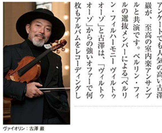
ヴァイオリン: 古澤 巖

そんな世界のケルト圏からトップクラスのアーティストたちが「ハローモニーホールふくい」に集結!豪華なフェスティバルを繰り広げます。ノリの良いアコーディオンやフィドルの演奏、「リヴァーダンス」で知られる見事な足さばきのダンス、郷愁を誘う美しい歌声などなど、めくるめくるケルティック・エンターテインメントはきつとみなさんのクリスマスに特別な思い出をプレゼントしてくれるでしょう。コンサート前にはクリスマス・ツリーの点灯式があり、「ハローモニーホールふくい」のクリスマス・シーズンは、この日から始まりです。