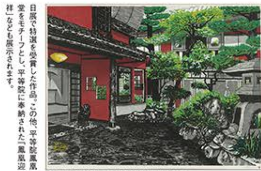
「紅樓傾城」2005年 ©HEEMORY / STEPeast

これだけ大規模な仏像展は県内では25年ぶり 県内では嶺南の仏像が注目されがちですが、嶺北にも、白山信仰の影響下にある素晴らしい仏像が数多くあります。