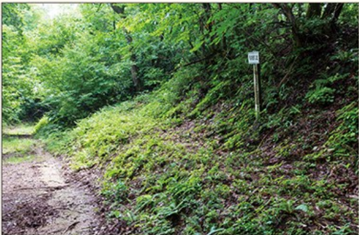
右側に、一段高く作られた馬の荷直し場がある

街道はこの先、少し下って湯谷を通り、中山峠を越え今泉で海を見て、河野へと続いてゆく。