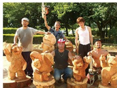
福井県総合グリーンセンターで2013年に行った「あすなるカービング倶楽部FUKUI」の実演。実演では、その場で丸太から作品をつくり上げる。この他、県立図書館や県立恐竜博物館などのイベントでも実演している。

たのは、池田町の木工品製造・体験施設に勤めていた20数年前。端材として捨てられる木にも興味がありました。 「素材として魅力的だし、いくらでも手に入るし、これ仕事しようと考えました」 2003年、自宅アトリエを開設。チェーンソーアートや木工の仕事を始めました。そんな生活に変化が起きたのは、東日本大震災の後です。 「日本が変わる、当たり前前の生活が変わるのではという漠然とした危機感がありました。そんな時、町内の林業に後継者がいないという話を聞きました。簡単に手に入ると思っていた木も、自分が欲しいものが山から出てこないと感じていたこともあり、山に入ってみようと思ったんです」 林業会社に入社し、林業とチェーンソーアート作家の2足のわらじを履くことに。 「山仕事をするようになって、人とエネルギーの関係が、より考えるようになりました。池