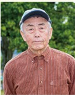
出身地/1933年 福井市生まれ 著 書/福井の山150 夜明けの霧の山 日本海の見える山 など

馬借、中世に始まった運送業者のことだそう。日本の各地、主要な物資の輸送ルートに集まっていた。