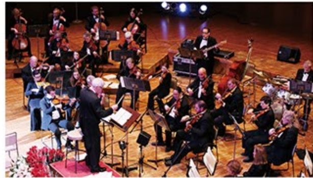
ハリウッド・フェスティバル・オーケストラ

2017年の「ハローモニーホールふくい」の幕開けは、とことんエンターテインメント。極上のサウンドと歌声で、映画音楽の世界を楽しんでい