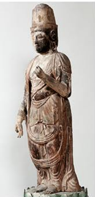
加多志波神社(鯖江市川島町)の聖観音菩薩立像(木造、平安中期、県指定文化財)

白山開山1300年イベント 平成28年秋季特別展 福井の仏像 一白山を仰ぐ人々と仏たちー 福井市立郷土歴史博物館 10/14(金)~11/23(水・祝)