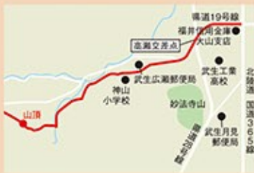
※参考文献「福井県歴史の道調査報告書 第6集 馬借街道・海の道」(福井県教育委員会)