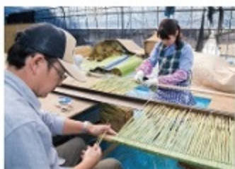
このノ縄のために特化した枠を使って、長さを揃えながら編んでいく。うしろには、日光を避けるために様々なもので覆われた葉の山が見える