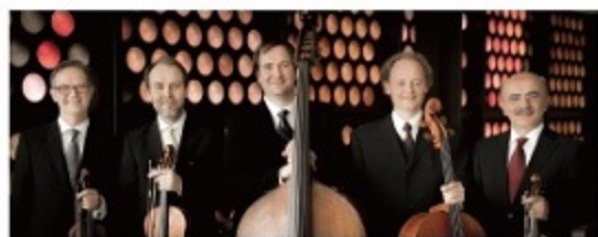
ベルリン・フィルハーモニー ヴァルトオーゾ