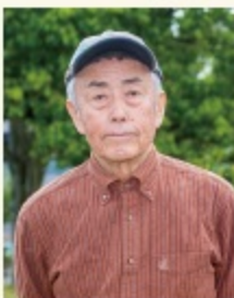
出身地 / 1933年 福井市生まれ 著 書 / 福井の山150 夜明けの霧の山 日本海の見え山 など