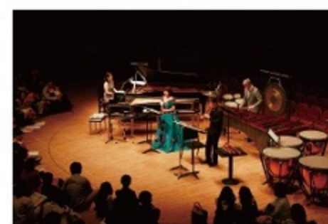
ピアノ、チェンバロ、リコーダー、マリンバ、ティンパニー、所楽しと並べられた楽器 と、それらを演奏するアーティストが目の前に！子どもたちの目が輝いていました。

●マリンバのひくい音がとてもおもしろかった です。チェンバロは小さい音だけど、きれいな音で もてきまかかったです。 ●サッポロのおんがりがどう。オナノメの リコーダーの種類がたくさんあっておもしろ かったです。1番大きいのをふいてみたいと思 いました。チェンバロの音もきれいで感動 しました。 ●マリンバで「マレット」を4本ももってひいて たのがすごかったです。 ●11才・女の子 ●6才・男の子