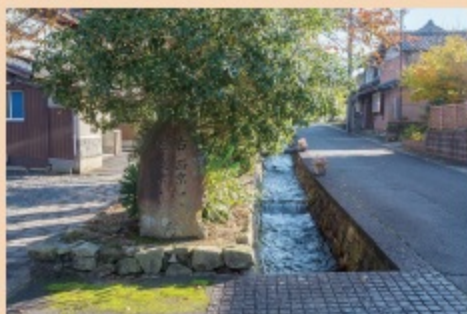
水路沿いに集落の中を南に下ると、「右西京 かい津志はつ 左東京 きの本」と刻まれた石の道標があり、街道の分岐点であったことを示している