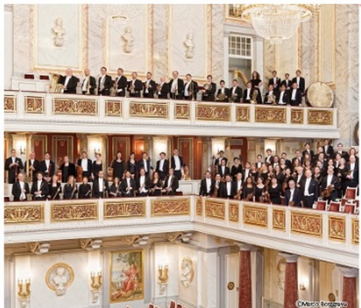
管弦楽：ベルリン・コンツェルトハウス管弦楽団