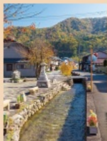
水路は、両側の道路拡張のため昔の1/3ほどの幅になっているが、集落の中はどの一部分も、川底に舟の漕ぎをよくする脚木が沈められるなど舟川が復元されている。幅9尺の川に幅7尺長さ3間の引き舟が行き来し、川の両側から綱で舟を引っ張り上げていた

と考えた人は昔からおり、平安時代には越前国司であった平重盛が試掘を行ったとされています。江戸時代に入つて、文化13(1816)年、敦賀湾から正田までの運河が完成しました。江戸時代の終わり頃までは利用されていましたが、その先の完成を見ることなくその役割を終えました。運河の遺構である水路は、今も正田の集落の中心を流れ、散策が楽しめます。