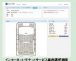
インターネット・チケットサービス購買履歴画面

*公演の7日前から2日前までのご購入は、カウンター利用のみ。 *ご購入日より前日は、インターネット経由でのご購入はできません。