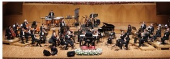
ハリウッド・フェスティバル・オーケストラ