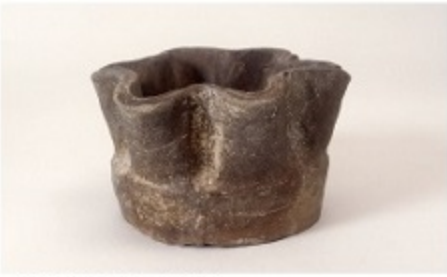
一乗谷朝倉氏遺跡出土の越前焼

一乗谷の人々の生活に 欠かせなかった越前焼 一乗谷朝倉氏遺跡から多く出土している越前焼を、館蔵品を中心に展示します。甕、壺、摺鉢などの生活用品のほか、花生や茶道具もあります。茶道具は越前焼には珍しく、注文品と思われまます。また、朝倉氏と同時期に栄え、越前焼の供給地であった宮崎・織田の生産地の様相も合わせて紹介します。 12月18日には展示解説、関連イベントとして、「拓本でお作りをしよう」(1月15日、越前焼の模様を写してしおりを作成。子ども向け)、公開フォーラム「一乗谷朝倉氏遺跡を支えた「越前大窯」(2月19日)があります。