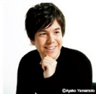
ピアノ：金子三勇士

ピアノ好きには絶対聞き逃せないステージ 3人のピアニストが3台のピアノで、ソロ、デュオ、トリオと、ピアノの可能性と魅力を伝えます。作曲家・編曲家の顔も持つ中野翔太、クラシックの王道を歩みつつ彼のもう一つの母国ハンガリーの音楽の民族性も感じさせる金子三勇士、