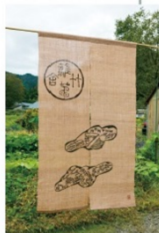
杉の葉で染めたのれん。「竹藪茅舎」の文字とその風景がデザインされている