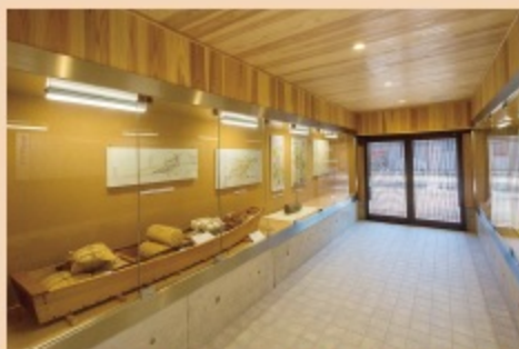
復元舟川の横には「愛発(あらかち)舟川の歴史展示室」があり、ベンチで休憩したり、舟川の歴史を見たりすることが出来る