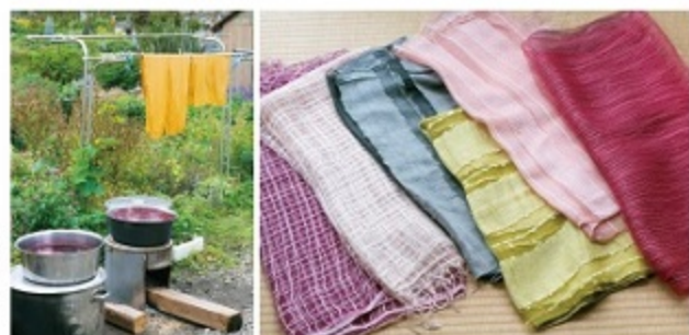
(右)ストール。生地は材質も様々 (左)工房の庭。アカネの根を煮出して、絞るという作業が出るそうだが、干してあるのは、薬方にも使われる黄金花(コガネバナ)の根で染めたのれん

の言う世界です」。地元の草木だけでなく、購入した草木染め染料も使い、同じ色で何度も染めて濃くしたり、最後に違う色で染めたりして、布や服を味わい深い色に仕上げています。「安全で安心して暮らせる田舎になるといいなと思って、草木染めはその一環のつもりです。無農薬での畑づくりも続けています。でも、自然に関わる仕事をしたいとは思っていません。まさか草木染めが仕事になるとはなあ」。福井カルチャーセンター「ふくい工芸舎」福井市自然博物館などで講師を務め、自分の工房でも教えています。「教えた人が上手になっていくのが楽しい。結局、英語教師の頃から教えることが好きなんです」