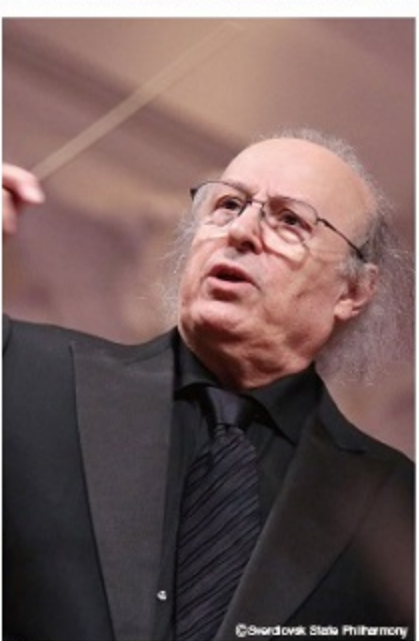
指揮：エリアフ・インバル

まされていましたが、ウィーンにフランス軍が攻め込み、貴族中心だった社会が大きく変わろうとしていた時で、作品にも新たな時代への心意気を感じられます。ソリストは上原彩子。インバルと、これまでに2回共演しています。彼女からは今回のステージについて、「『皇帝』は、オーケストラにとって大変な曲