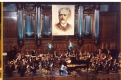
第12回「チャイコフスキー国際コンクール」ピアノ部門優勝時の写真(2002年) 「印象に残る曲」として選んだのは、シューマン作曲 ピアノソナタ 第3番「グランドソナタ」、シュタコフヴィチ作曲 ピアノソナタ 第1番など。