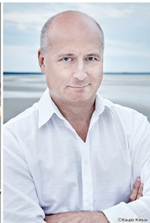
指揮：パーヴォ・ヤルヴィ