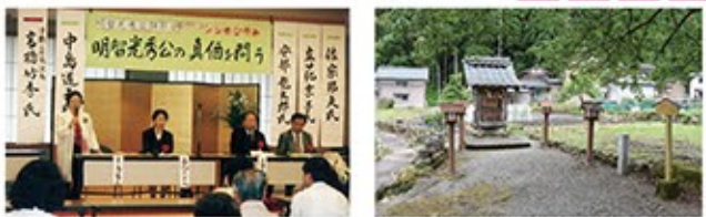
県外の明智光秀ゆかりの団体とも交流している 明智神社は高さ2mくらいのおきな神社