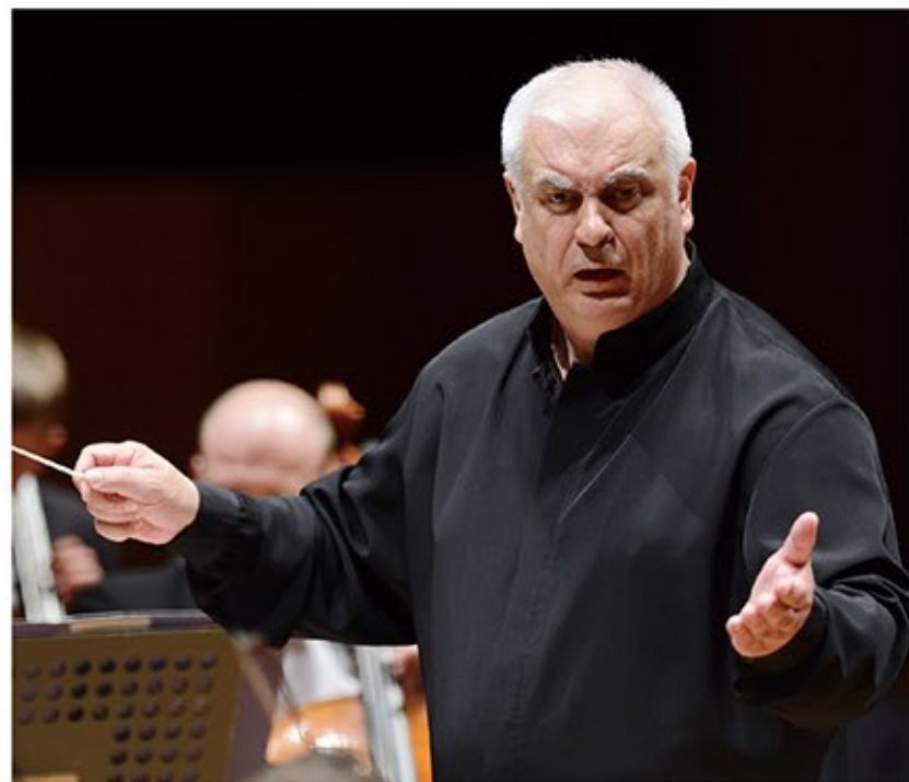
指揮：ヴァレリー・ポリャンスキー