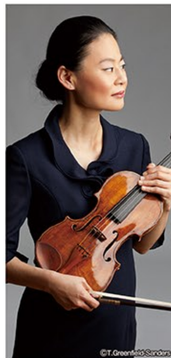
ヴァイオリン：五嶋みどり