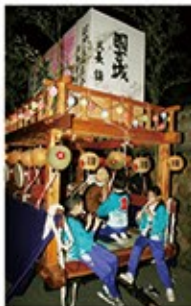
地域の例大祭(日吉神社祭礼など)の獅子伝承に努めている