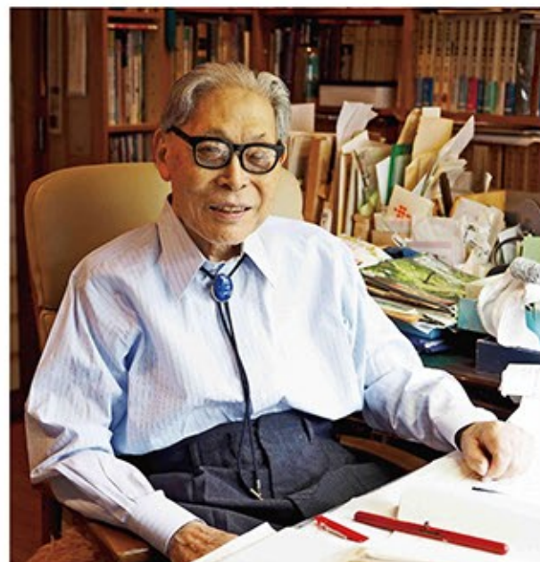
アトリエにて

絵本作家の知られざる一面にせまる 昨年5月に亡くなられた越前市(旧武生市)出身の絵本作家、加古里子(1926-2018)。600冊以上の作品を描き続け、それでもまだ「子どもたちのために」と、亡くなる直前まで筆を執り続けた。そんな加古とは、どのような人物だったのでしょうか。作品づくりの背景には、戦争に生き残った後悔を抱えながらも、セツルメント活動へと参加し子どもたちを見守った加古自身の経験がありました。生涯を通して貫いた信念と流す。