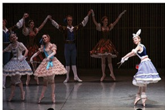
「人形の精」は、バレエ教室の発表会でも馴染みの演目。会場に詰めかけたバレエを学ぶ子どもたちが熱心に学びの視線を注いでいました。

●「人形の精」が特にワガノワアカデミーの子たちが可愛らしくびびりだした。(40代/女性) ●エトワールの人がとても素敵でした。空気をつつみこむような手の動きが素晴らしいです。(50代/女性) ●福井ではあまり観られない本格的バレエを観ることができて楽しかったです。(60代/男性) ●きれいな演技と生演奏がコラボしている！つま先がすくすくきれい！(10代/女性)