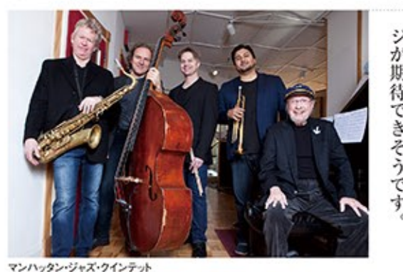
マンハッタン・ジャズ・クインテット

35周年記念ツアーでジャズの真髄を伝えるMJQ マンハッタン・ジャズ・クインテット(MJQ)は、グラミー賞受賞ピアニスト、デビッド・マッシュューズを中心にニューヨークの一流ミュージシャンで結成。1984年にデビューして以降何度かのメンバー・チェンジを経て、今年めでたく35周年を迎える、ジャズ界のトップ・グループです。 マッシュューズはNHKのテレビ番組でレギュラーを務めたこともある日本通。彼の流暢な日本語MCもコンサートの魅力のひとつです。実はMJQは、東日本大震災直後に、お世話になった日本のファンに恩返しをしたい」と全国ツアーを行ったほど、日本と関係の深いバンドなのです。 今回もスタンダード・ナンバーを中心に、「これぞジャズ」というグルーブ感溢れるステージが期待できそうです。