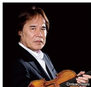
ヴァイオリン：徳永二男

日本のクラシック音楽界を長きにわたって牽引しているヴァイオリンの徳永二男、チェロの堤剛、ピアノの練木繁夫。3人が初めて共演したのは1998年、徳永が音楽監督を務める「Tアートホール」で行われた室内楽シリーズだそ