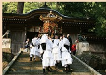
「神と紙の祭り」が行われるのは5月の連休。山上の奥の院から、神輿に乗せて御神体がお下りになり、5つの集落を回る。少しでも長く御神体をとどめたい地区の人と、早く迎え入れたい後の地区の間では、激しい競争合戦があるという