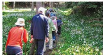
シャガの群生地は住民の手で大切に守られている