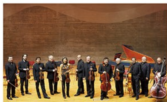
イ・ムジチ合奏団