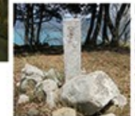
本丸跡の国吉城址碑