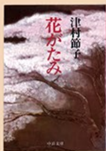
津村節子「花がたみ」 1995年 中公文庫(元本は1992年 中央公論社刊)

撮影をしたのは、早春の晴れ間。物語の中で主人公たちが見た時の晴れやかさはありませんが、瓦屋根は同じように艶やかな光を放っていました。