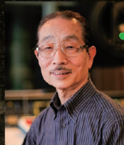
坂田晃一 (ゲスト：作曲家)