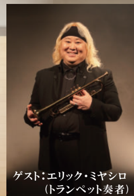
ゲスト:エリック・ミヤシロ (トランペット奏者)