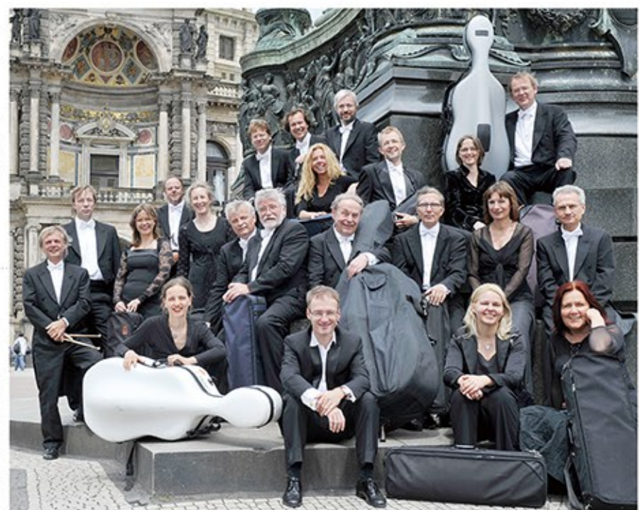
管弦楽：ドレスデン国立歌劇場室内管弦楽団

歌劇場の名門 オーケストラの精鋭たちと 日本の歌姫の共演 とびきり贅沢な歌と名曲の コンサートです。 「ウイーン・ウィルトゥウオーゼ ン」「プラスクインテットウイ ーン」「ベルリン」といった、ウイーン・ フィルやベルリン・フィルの精鋭 メンバーで構成するアンサンブル が、「ハートホールふくい」に もたびたび訪れています。共 通しているのは、一人ひとりの 演奏技術が素晴らしいこと。 今回はドレスデン国立歌劇場 管弦楽団からの選抜楽団。歌 との相性も抜群の室内楽アン サンブルの登場です。 母体となるドレスデン国立歌 劇場管弦楽団は、歌劇場専属 のオーケストラ。16世紀から続 くヨーロッパ屈指の老舗楽団で す。ウエーバー、ワーグナーなど、 そうそうたる作曲家も指揮を 執ってきたという、音楽史とと もに歩んで来た歴史を持ちま す。その精鋭による室内楽団 は、母体オーケストラのエッセ ンスを凝縮して聞かせてくれま す。