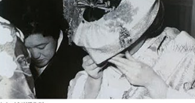
イッシュウミズ(福井市)