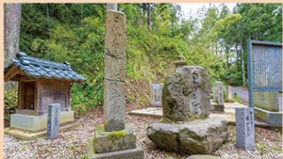
北陸道と吉崎道の分岐点(追分)には、地藏堂、道標、石碑、説明看板などが立っている