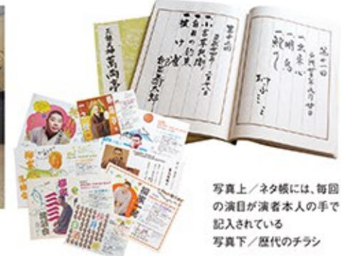
写真上/ネタ帳には、毎回の演目が演者本人の手で記入されている 写真下/歴代のチラシ