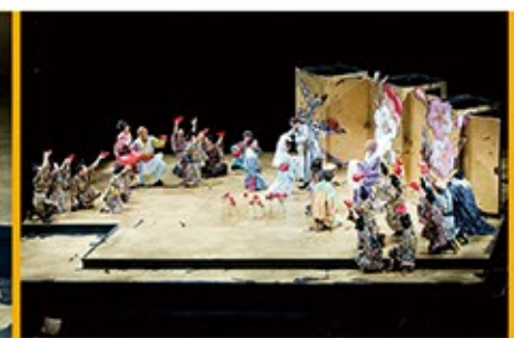
井上道義指揮×野田秀樹演出 歌劇「フィガロの結婚」～庭師は見た！～では、庭師に扮してオペラ全体のストーリーテラーを担い好評(2015.5.26 全沢歌劇座)