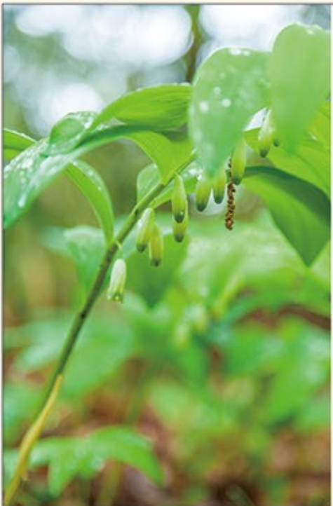
街道わきに咲いていたミヤマナルコユリ

出身地/1933年 福井市生まれ 著書/福井の山150 夜明けの霧の山 日本海の見える山 など