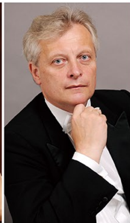
指揮：ヘルムート・プラネー