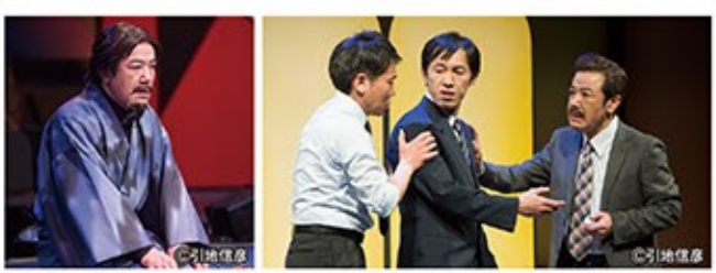
左/ナイロン100℃ 41st SESSION パン屋文六の思案～続・岸田國士一幕劇コレクション～(作:岸田國士 潤色・構成・演出:ケラリーノ・サンドロヴィッチ) 右/ナイロン100℃ 39st SESSION デカメロン21～或いは、男性の好きなスポーツ外伝～(作・演出:ケラリーノ・サンドロヴィッチ)

たらいいなとは思っていましたが、俳優になるとは思っていなかったなあ」 会社勤めをしながら、社会人劇団で活動を始めますが、土日に休めない職種のため、公演になかなか出られません。本番に出たい一心で仕事をやめてしまいました。 「アルバイトをしながら芝居をやっていたんですが、だんだん、このままでいいのか、と思いはじめて……それと不遜かもしれませんが、もっと力のある共演者や演出家と一緒にやったら