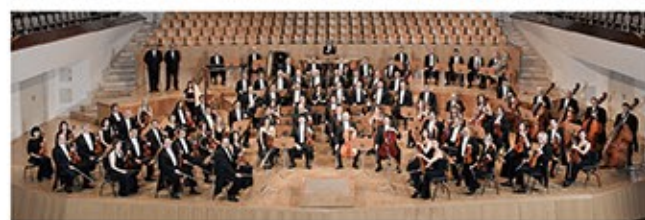
管弦楽：スペイン国立管弦楽団

りました。特に絵画や音楽では、スペイン的なものを作品に取り入れる「スペイン趣味」が大流行。ラロの「スペイン交響曲」