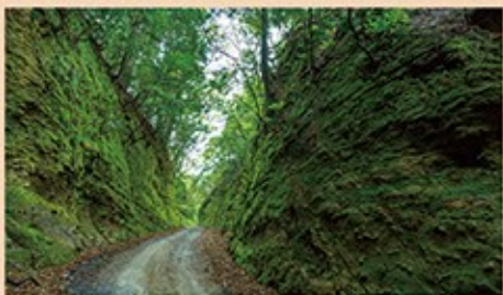
吉崎道(蓬如道)。かつては吉崎参りの難所と言われた山道だったが、明治時代に現在のように切り下げられた