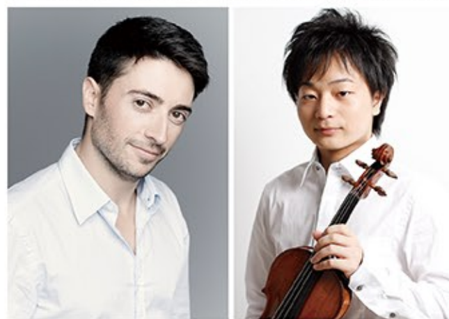
指揮：アントニオ・メンデス

このコンサートでは、音楽に乗って身体を動かしてほしい。演奏が終ったら、歓声を上げてほしい。そんな熱いコンサートがやってきました。太陽と情熱の国を音楽で体験させてくれるスペインのオーケストラの、26年ぶりの来日ステージです。 「スペイン音楽を本場スペインのオーケストラで」が今回のコンセプトですが、ひとくちにスペイン音楽と言っても、スペイン人作曲家のものだけではありません。今回演奏されるラロやラヴェルはフランス人です。19世紀のフランスには、エキゾチックなスペインに対する憧れがあ