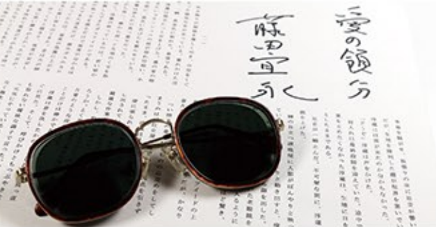
藤田さんのトレードマークのサングラスと、直木賞受賞作「愛の顔分」サイン入りワープロ原稿

この夏は涼しい館内でミステリー三昧はいかが? 皆さんを推理小説などミステリー文学の世界へ招待します。福井県出身の直木賞作家藤田宜永さんの代表作「探偵・竹花シリーズ」をはじめ、福井県ゆかりのミステリー作家や県内を舞台にした作品を紹介。あわせて、藤田さんが影響を受けた国内外のハードボイルド作品も取り上げ、ミステリー文学の魅力に迫ります!