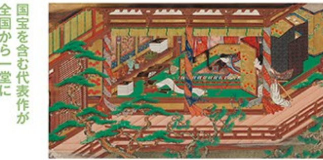
重文「上瑞瑠物語絵巻」巻4部分 静岡・MOA美術館蔵

婚礼が派手だと言われる福井。その在り方は、戦後大きく変化してきました。福井の婚礼の風習と変遷を、嫁入り道具や打ち掛けなど実際の道具・衣装と写真で紹介いたします。 7月24日(日)、31日(日)、8月7日(日)は14時から展示説明会があり、24日と31日は説明会に先立って「まんじゅうまき」が行われます(特別展観覧券が必要です)。もっと深く知りたい方は、7月23日(土)の「ふくい歴史博講座・ふくいの婚礼」にどうぞ。