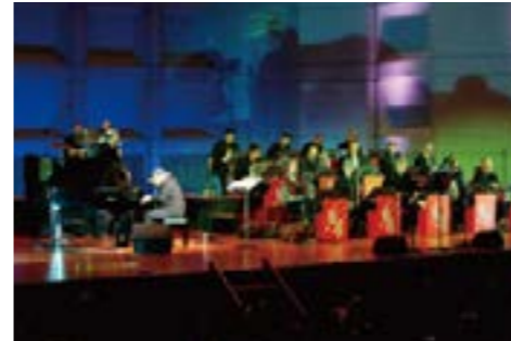
マンハッタン・ジャズ・オーケストラ

これまでの公演チケットはいずれも完売の大人気。ジャズの大御所デビッド・マッシュ率いるマンハッタン・ジャズ・オーケストラ(MJO)が、結成25周年記念ジャパンツアーを敢行。世界のトップ・プレイヤー集団が再び福井にやってきました。