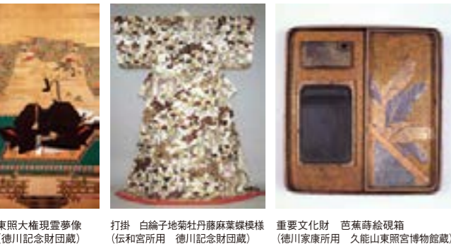
東照大権現堂尊像(徳川記念財団蔵) 打掛 白編子地菊牡丹藤麻葉蝶模様(佐和宮所用 徳川記念財団蔵) 重要文化財 芭蕉時絵硯箱(徳川家康所用 久能山東照宮博物館蔵)

「徳川将軍家の名宝」では、武器や書画、華やかな道具類など重要文化財5点を含む徳川将軍家ゆかりの名宝を展示します。福井藩初代藩主結城秀康は徳川家康の次男にあたり、越前松平家は代々徳川将軍家との結びつきの強い親藩大名でした。今回の展覧会では、「武家の棟梁」にふさわしい将軍の威厳や美意識、将軍とその夫人たちの教養、大奥での優雅な生活文化をご紹介します。