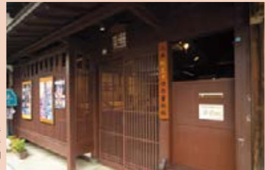
「三丁町」からほど近い場所に位置する「町並み保存資料館」。明治中期に木綿問屋だった建物を改修

小浜町並み保存資料館 小浜市鹿島40番地 ☎0770-53-3443 開館時間 / 9:00~17:00 入館無料 毎週火曜日休館