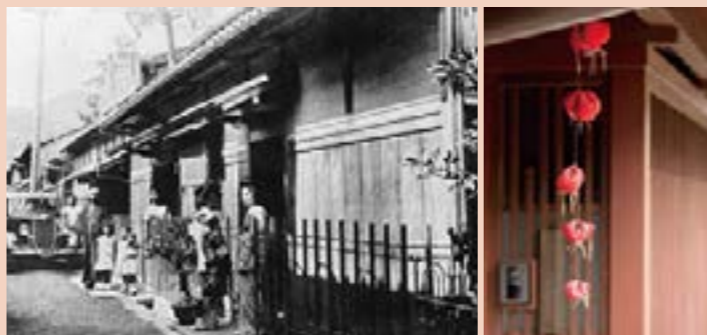
(写真左)現存する建物のほとんどが、大正時代以降に建てられた。写真は、大正初期ごろの「三丁町」の様子(写真右)「身代わり猿」は「三丁町」界隈の風習。悪病や災難を遠ざけると言い伝えられている