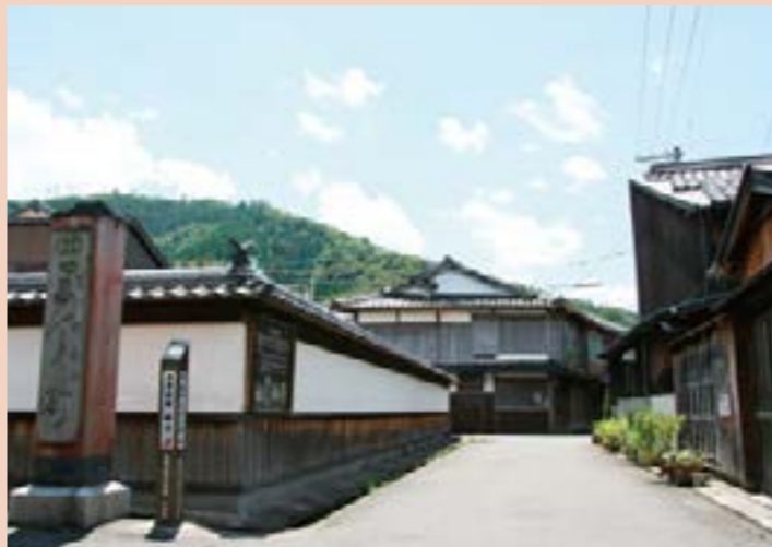
町並みが三丁(約250メートル)続くことから、「三丁町」と名付けられた

豊かな自然に囲まれた小浜は、古来、朝廷に「御贄(みにえ)」「御食」「天皇の御食料を指す」を納めていたことから、「御食国(みつけくに)」と呼ばれていた歴史・文化ともに深い町です。今回ご紹介する、小浜西組地区にある「三丁町」は、江戸時代