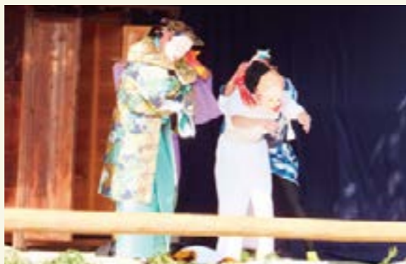
国選択無形民俗文化財に指定されている「和久里壬生狂言」