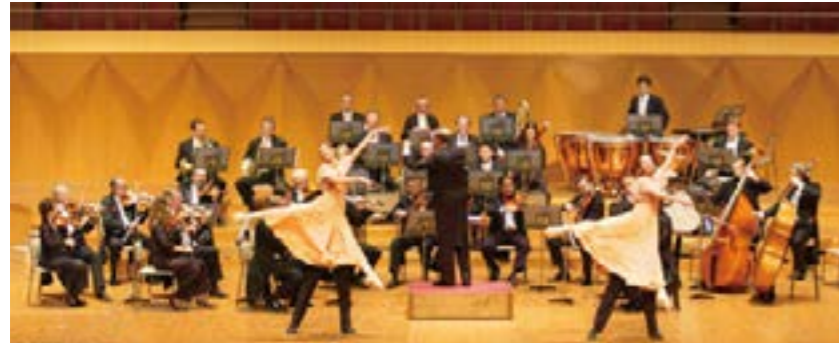
ウィーン・オペラ舞踏会管弦楽団

歌とバレエで魅了する 本場ウィーンの舞踏会 ウィーンの冬と言えば、一面の銀世界。ところが、謝肉祭の季節には、厳しい寒さをよそに街のいたるところで舞踏会が花盛り。ドレスや燕尾服をめかしこんだ男女が、ワルツの調べに乗り、夜な夜なクルクル回って踊り明かす。舞踏会は、旧き佳き時代から続く、国をあげての名物行事なのです。 オーケストラやバレエダンサーの人数も増え、より迫力が増したパフォーマンスをお届けする、2015年のニューイヤークンコンサート。演奏はウィーン国立歌劇場で、毎年2月に開催される「OPERNBALLET」