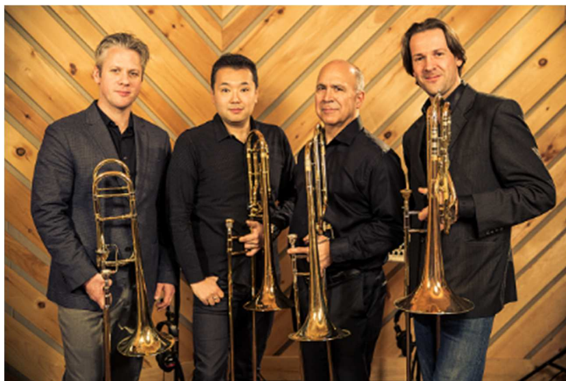
Slide Monsters

吹奏楽やオーケストラで演奏する方々も、個人で演奏する方々も、お申し込みをお待ちしています。