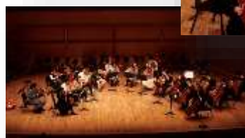
2018年2月26日(月) ハーモニーホールふくい 小ホール 東京チェロアンサンブル 公開クリニック

開講14年目を迎える“福井ジュニア弦楽アンサンブル・セミナー”の受講生を募集します。 今年度も、県内施設を会場に開催するアウトリーチ・コンサートへの出演、一流演奏家によるクリニック、 そしてレッスンの集大成である「ジュニアが輝く!“音楽の森”コンサート2020」の開催を予定しています。 みなさんのご応募をお待ちしています！