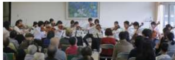
2018年11月23日(金・祝) あさむつ苑1階 メインホール アウトリーチ・コンサート