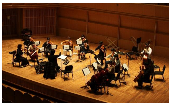
2020年12月22日(火) ハーモニーホールふくい 小ホール 東京フィルハーモニー交響楽団メンバーによる特別クリニック