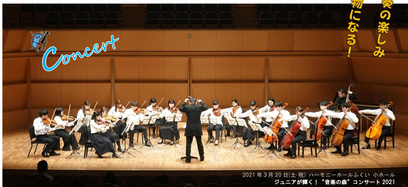
2021年3月20日(土・祝) ハーモニーホールふくい 小ホール ジュニアが輝く！“音楽の森”コンサート2021

開講16年目を迎える“福井ジュニア弦楽アンサンブル・セミナー”の受講生を募集します。